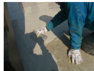
アロンコート SQ 2回目