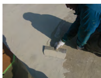
アロンコート SQ 1回目