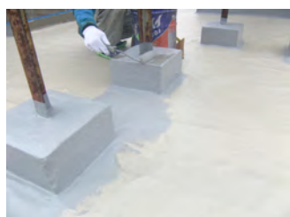
保護材 (アロン FTS) 塗布状況