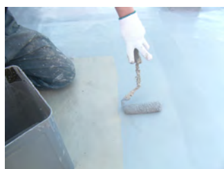
保護材 (アロン FTS) 塗布状況