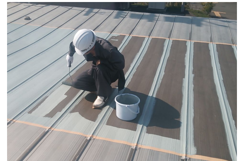
アロンMDルーフカラーS i 塗布