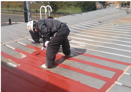
アロンマイルド防錆プライマー塗布