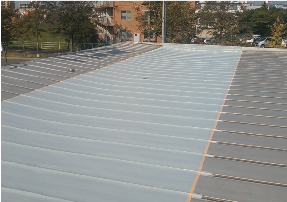
アロン防錆コート施工完了