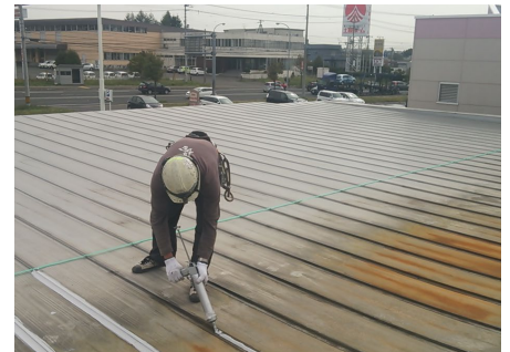
板金ハゼシーリング