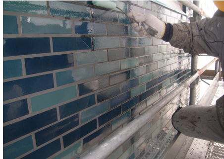
工程 - 下塗り