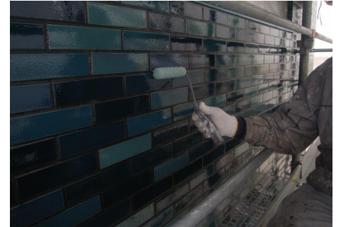
工程 - 中塗り