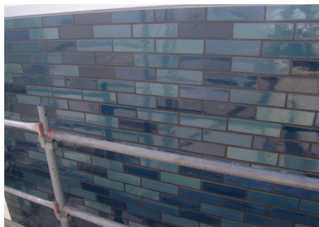
工程 - 施工完了