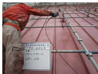
アロンMDルーフカラー S12 回目