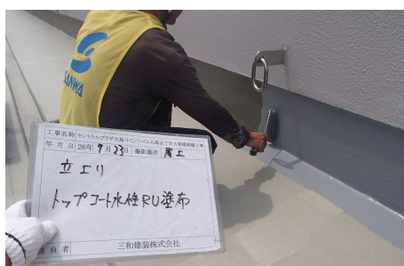
水性 RU 塗布