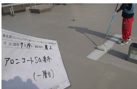
平場 アロンコート SQ 塗布