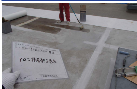
通気緩衝シート貼り