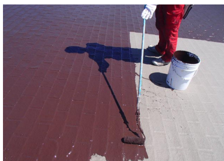
トップコート塗布