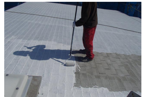
水性プライマー塗布