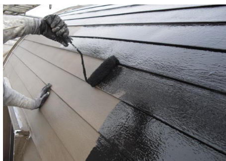
MD カラー U 塗布