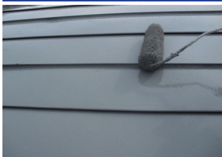
マイルド防錆プライマー塗布