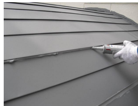
鉄板屋根ジョイント部シーリング