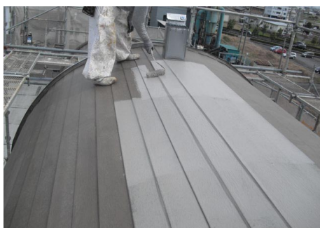
QD 塗布 2 回目