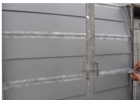
屋根ジョイント部アロンゴムシートテープ貼付け