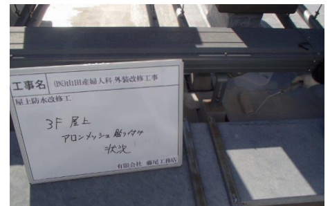
アロンメッシュ貼り付け