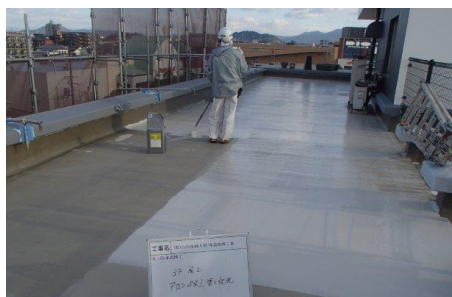
アロン SQ 塗布 2 回目