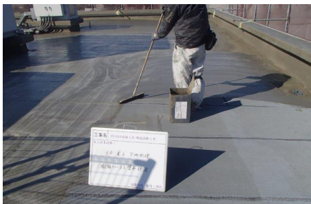
樹脂ペースト塗布