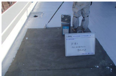
アロン水性プライマー塗布