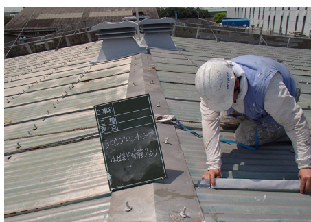
アロンゴムシートテープ