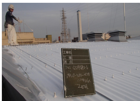
アロンMDクールカラー