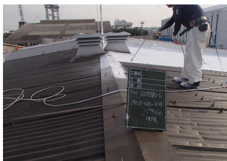
アロンMDクールカラー