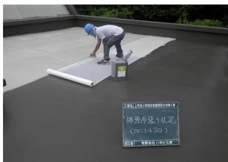
アロンメッシュ張り