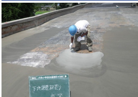
アロンQD-S塗布（既存ゴムシート撤去後）