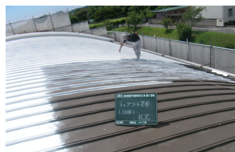
アロンMDクールカラー塗布