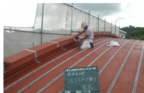
ゴムシートテープ貼り